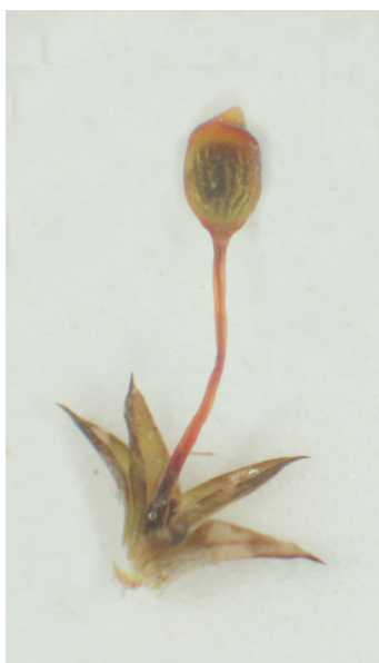
Abb.3: Pottia davalliana

Übereinstimmenden Literaturangaben zu Folge kommt T. marginata auf feuchtschattigem kalkreichen Gestein vor, was für diesen Fundort nicht zutrifft.