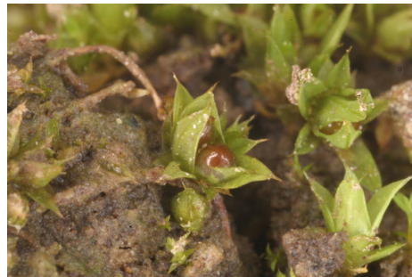
Abb. 5: Phascum curvisetum

Ein weiteres Beispiel einer vermutlichen Sporenbank konnte zur selben Zeit einige hundert Meter weiter beobachtet werden. Im Tal des Rolandswerther Baches war ein Fischteich abgelassen worden. Am Grunde fanden sich nicht etwa die erwarteten Teichmoose, sondern Ackermoose wie Bryum rubens , Trichodon cylindricus , Funaria hygrometrica , Bryum argenteum , Bryum bicolor , Barbula convoluta , Ceratodon purpureus , Pottia intermedia u.a., und zwar in solchen Mengen, dass sie nicht erst nach Ablassen des Teiches dahin gekommen sein können. Erst daraus konnte man sehen, dass es eben nicht Archidium war, was dort wuchs, sondern nur Dicranella staphylina . Folgerung: hier befand sich zuvor ein Acker.