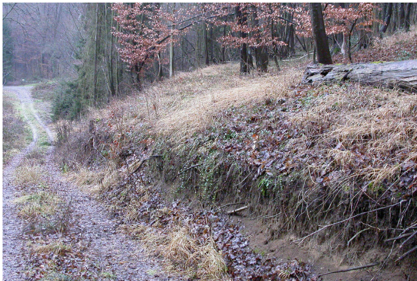
Abb. 1: Waldwegrand als Standort von Xerothermmoosen

In einem Seitentälchen des Rheins am Haus Humboldtstein bei Rolandseck (Rheinland-Pfalz Kr. Ahrweiler, TK 5309/3, 7,20188° E, 50,63402° N bezogen auf WGS84, 110 m NN) fanden sich am 8.2.06 an einem Waldwegrand (!) (Abb. 1) Arten wie Acaulon triquetrum (teste A. Oesau, Abb. 2), Phascum curvicolle (Abb. 4), Phascum curvisetum (Abb. 5), Weissia longifolia und W. controversa . Von letzteren gab es Hybriden (Abb. 3), ähnlich W. longifolia , aber mit kurz gestielten Seten. Phascum curvisetum wird von vielen Bryologen nicht unterschieden, ist aber