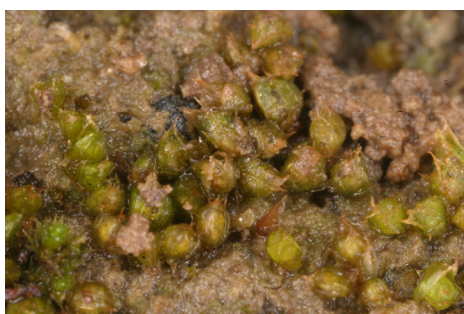
Abb. 2: Acaulon triquetrum

Die Arten standen in kleinen nur wenige Quadratzentimeter messenden Flächen an der oberen Abbruchkante auf Löss. Der Weg war vor einigen Jahren verbreitert worden, wobei die Kante entstand. Diese Arten sind eigentlich charakteristisch für Trockenrasen und ähnliche Standorte. Wie kommen die aber an einen Waldwegrand? Theoretisch über Sporen durch Fernverbreitung, welche alle Arten bilden. Die genannten Arten sind jedoch cleistocarp, so dass sich ihre Kapseln nicht öffnen, was eine Fernverbreitung nicht gerade begünstigt. Des weiteren wäre die Fernverbreitung der einen oder anderen dieser Art denkbar, aber kaum aller zusammen. Diese Kombination von Arten ist zwar durchaus typisch, aber nur noch an wenigen Stellen realisiert. Die nächsten mir bekannten Vorkommen von Acaulon liegen in Rheinhessen, von Phascum curvicolle im Mayfeld und im Ahrtal, von Weissia longifolia im Neuwieder Becken und in der Kalkeifel. In dieser Artenkombination kenne ich Fundorte erst wieder in Rheinhessen und im Elsass. Wie kommt es also zu solcher Häufung von Xerothermarten an so einem untypischen Standort? Phascum curvicolle war zuletzt in der Bonner Gegend von Brasch, Thyssen und Andres in der ersten Hälfte des 19. Jahrhunderts gefunden worden, Acaulon triquetrum und Weissia longifolia gar nicht. Der letzte Nachweis von Acaulon triquetrum aus dem Rheinland stammt von Herpell aus Str. Goar von 1870.