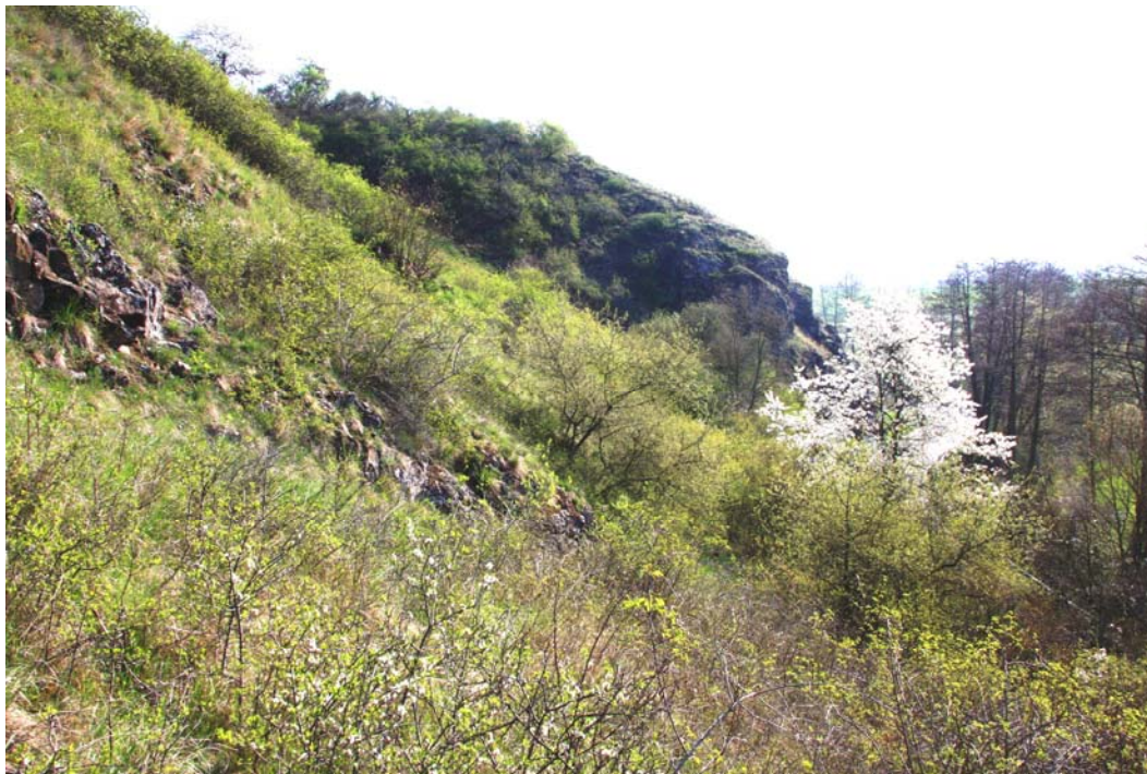
Abb. 2: Blick in das NSG „Am Kahlenberg“ bei Wendelsheim mit Trockengebüschen, Felstrockenrasen und Felsen.

Die Bestimmung der Moose erfolgte nach CASPARI (2004), FRAHM & FREY (2004) sowie NEBEL & PHILIPPI (2000, 2001). Die Nomenklatur richtete sich nach KOPERSKI, SAUER, BRAUN & GRADSTEIN (2000). Die Gefährdungsgrade von Rote-Liste-Arten nach LUDWIG et al. (1996), bzw. LAUER (2005) sind fett hervorgehoben.