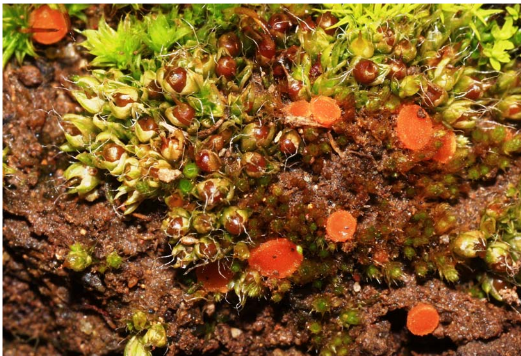
Abb. 3: Pterygoneurum subsessile und der auf Bryum bicolor parasitierende Moosbecherling Octospora coccinea (P. CROUAN & H. CROUAN) BRUMM. var. coccinea (Ascomyceta, Pezizales) im Felstrockenrasen des NSG Kahlenberg. Dieses Taxon zeigt eine Vorliebe für Kalktrockenrasen (BENKERT 1998).

Racomitrium elongatum FRISV. Schistidium brunnescens LIMPR. Schistidium singarense (SCHIFFN.) LAZ. Tortula calcicolens W.A. KRAMER Tortula ruraliformis (BESCH.) INGHAM.