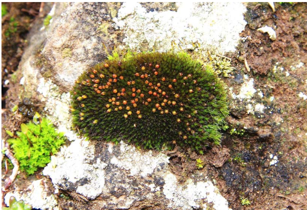
Abb. 4: Schistidium brunnescens auf Vulkanit im NSG Kahlenberg.

Brachythecium rivulare SCHIMP. Homalia trichomanoides (HEDW.) SCHIMP.