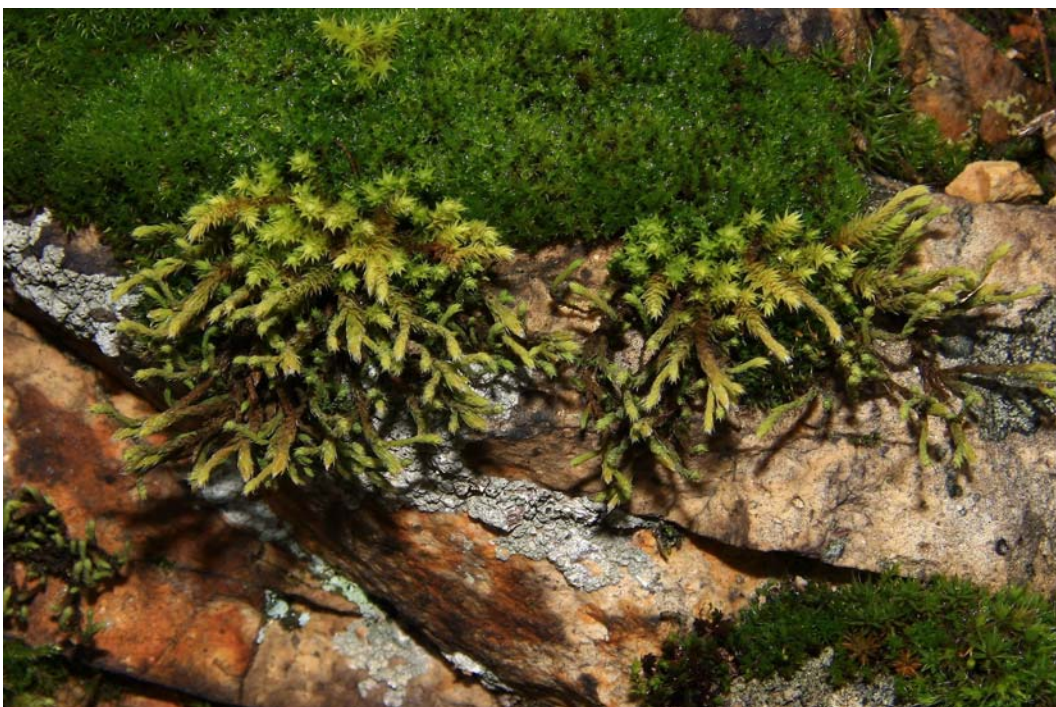
Abb. 3: Die subboreale Hedwigia ciliata im Naturdenkmal „Auf dem Bäder“ bei Bad Kreuznach.