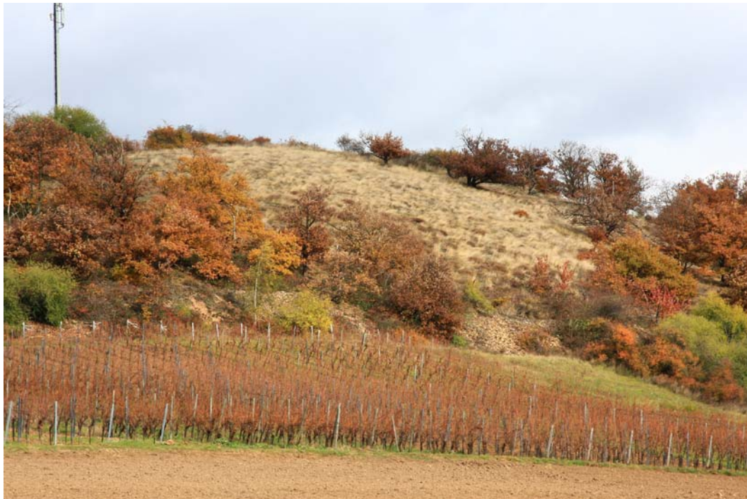
Abb. 2: Blick von Süden auf das Naturdenkmal „Auf dem Bäder“. Das Zentrum des Gebietes wird von einer subatlantischen Ginsterheide besetzt.