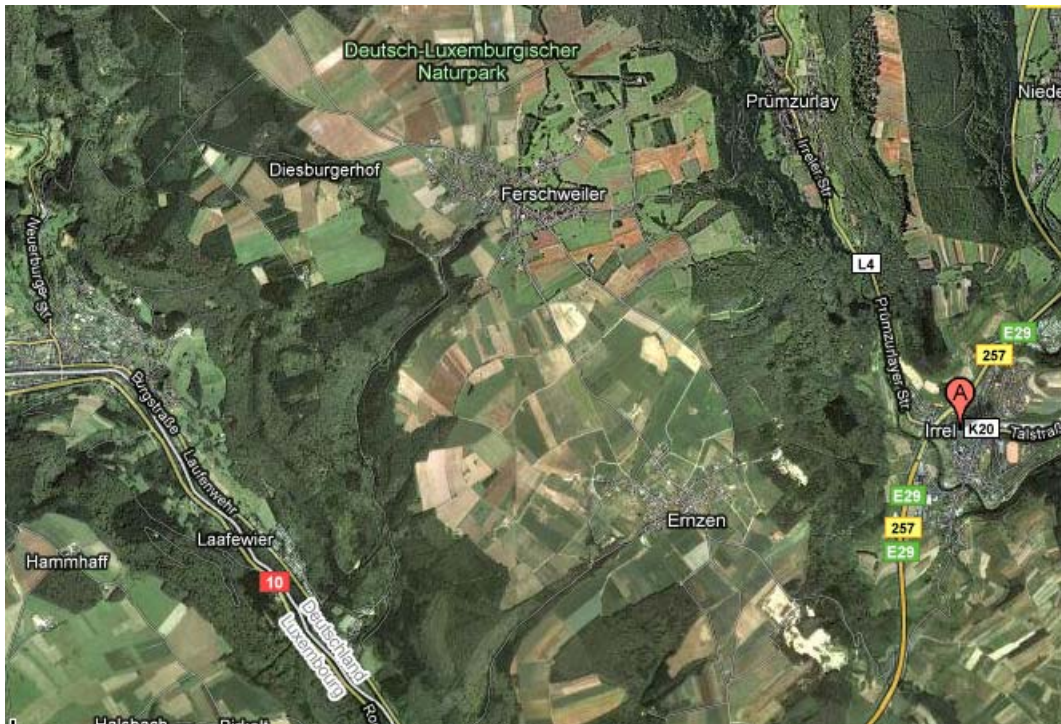
Abb.1: Lage des Ferschweiler Plateaus zwischen Irrel im Osten und der Sauer (Grenze zu Luxemburg) im Westen. Die Sandsteinkliffs und -schluchten liegen in den bewaldeten Teilen am Rande des Plateaus.