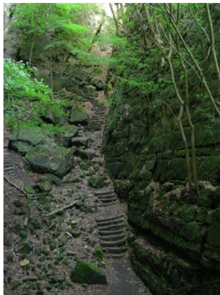
Abb. 3: Die Wolfsschlucht bei Echternach