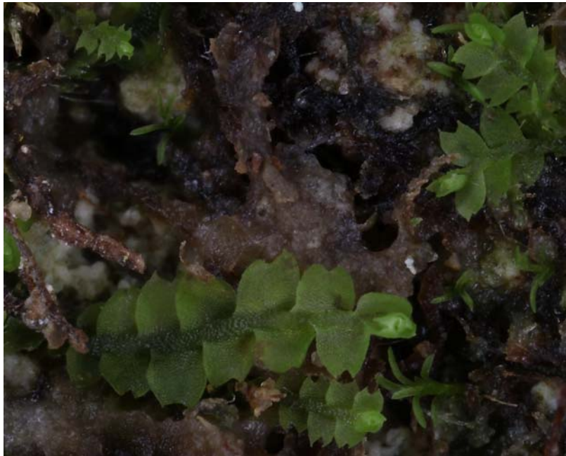
Abb. 5: Leiocolea badensis an den Irreler Wasserfällen.