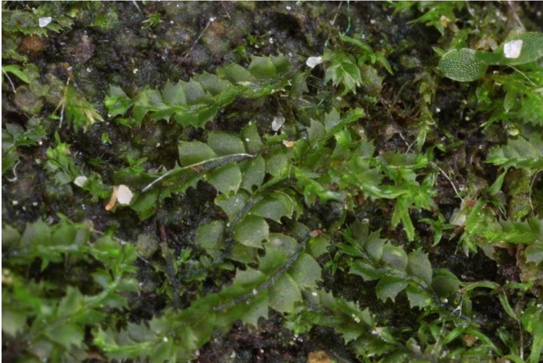
Abb. 4: Lophocolea fragrans in der Teufelsschlucht bei Irrel.