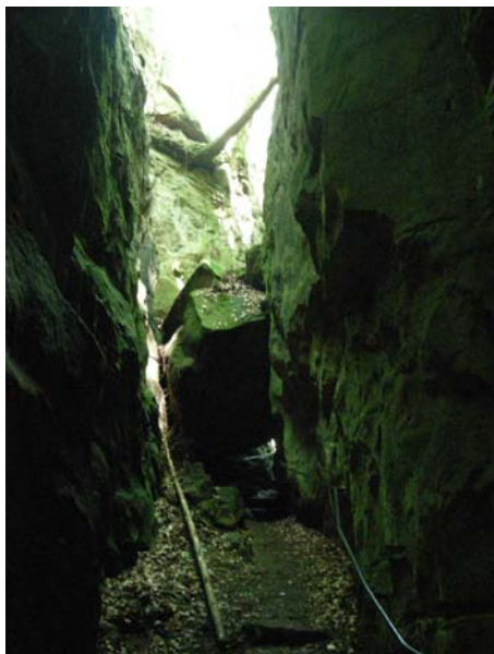
Abb. 2: Die Teufelsschlucht bei Irrel.