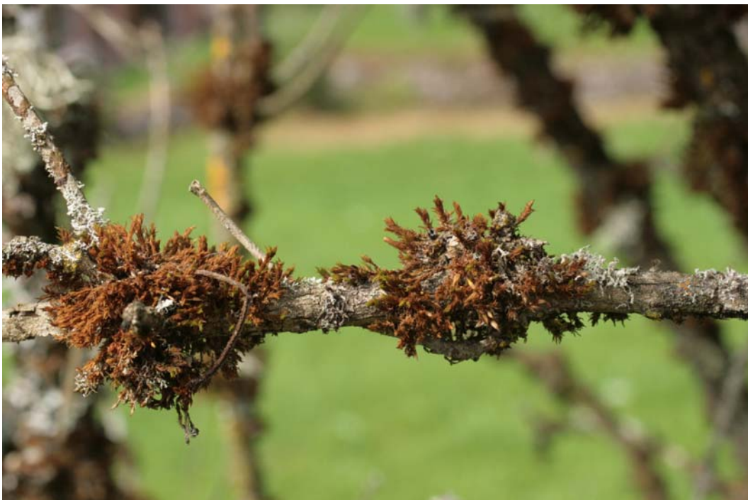
Abb. 3: Geschädigtes Orthotrichum affine (Vogesen Juli 2008)