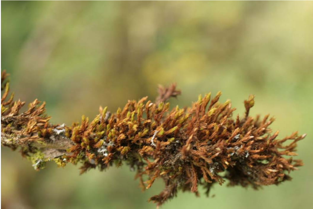
Abb. 2: Geschädigtes Orthotrichum affine (Vogesen Juli 2008)