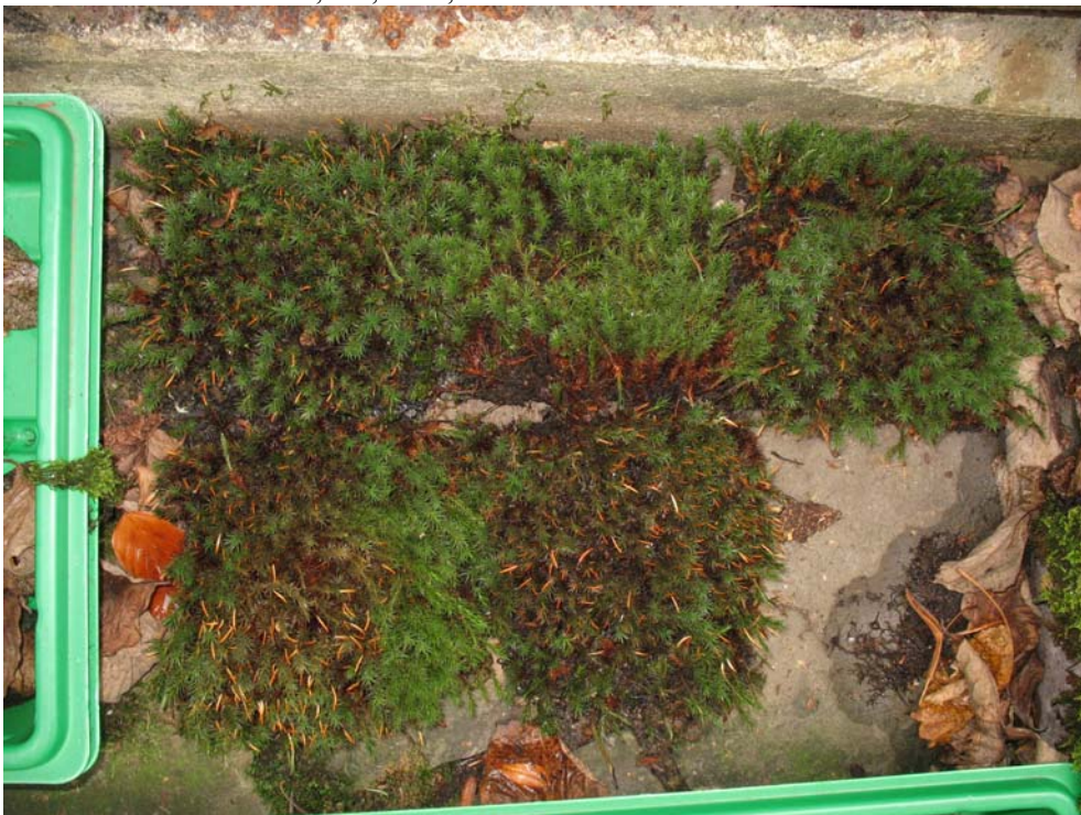
Abb. 6: Moosmatte mit Polytrichum juniperinum nach Hitzetest in feuchtem Zustand. Oben v.l.n.r. 30, 40, 50°C, unten 60°, 70°C.