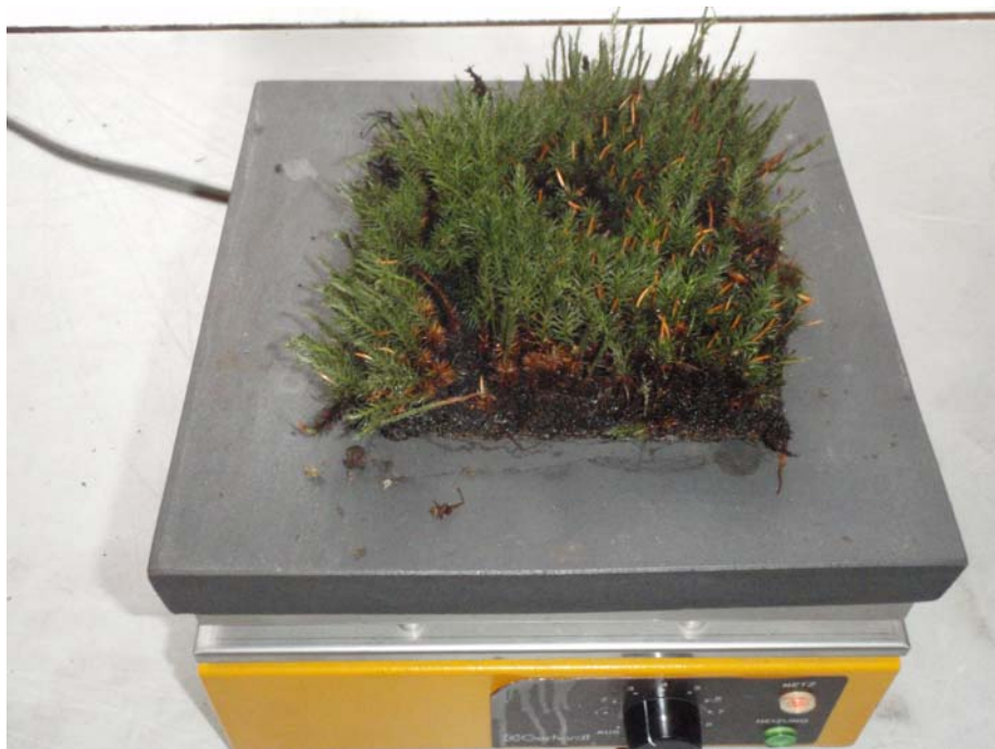
Abb. 4: Versuchsanordnung zu Hitzetoleranzversuchen mit Moosen

In dem vorliegenden Versuch sind im Gegensatz zu den früheren Publikationen die für die Mattenbegrünung verwendeten Arten auf Moosmatten getestet worden. Dazu wurden mit Polytrichum juniperinum als auch mit Ceratodon purpureus bewachsene Moosmatten in 10x10 cm Stücke zerschnitten und einzeln auf eine Wärmebank gelegt (Abb. 4). Die Temperatur der Wärmebank wurde so erhöht, dass die Oberflächentemperatur (mit einem IR-Thermometer gemessen) 30°, 40°, 50°, 60° und 70° betrug. Die Versuchsdauer betrug eine Stunde.