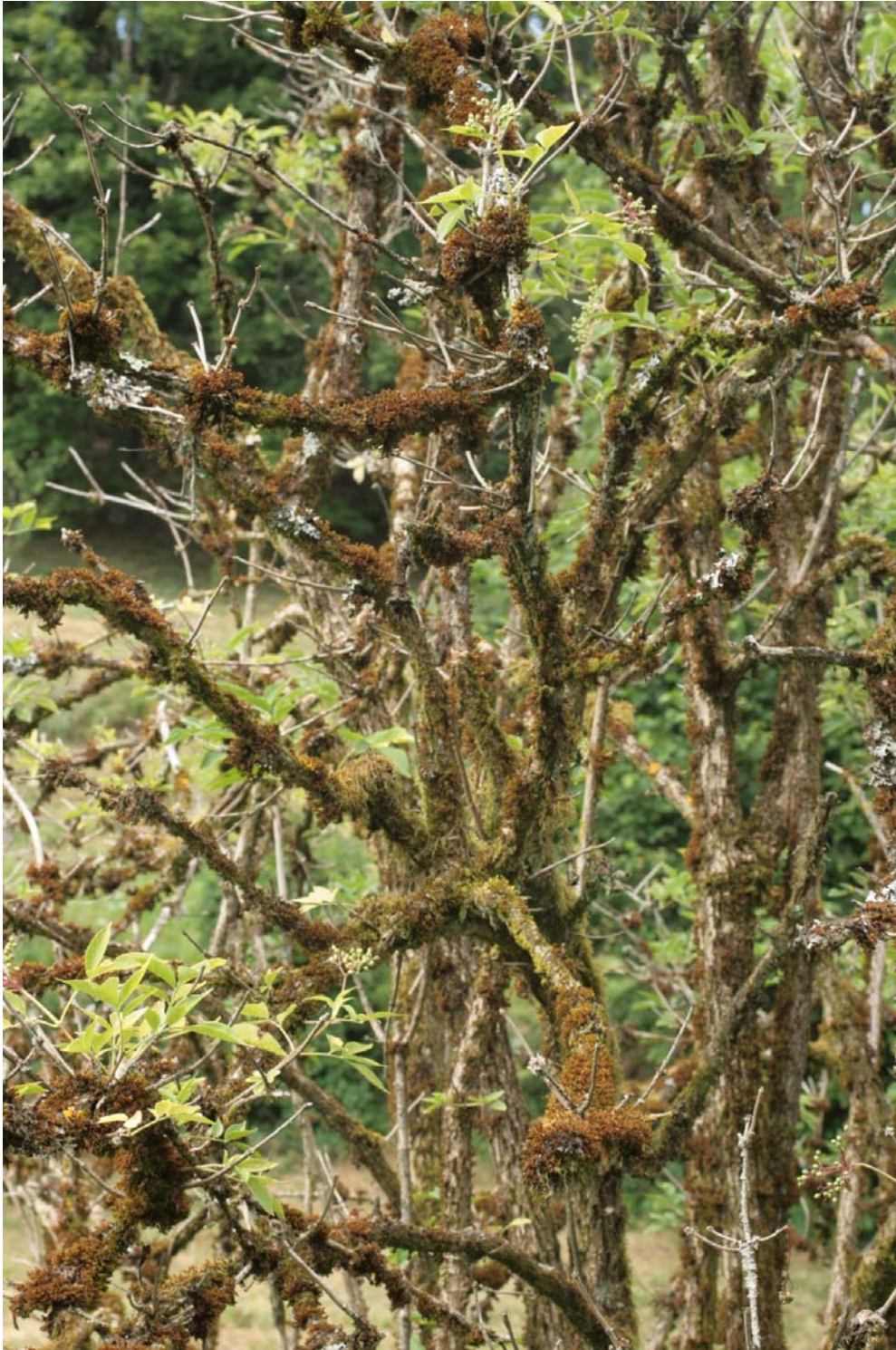
Abb: 1: Braun verfärbte Orthotrichen an einem Holunder, Vogesen Juli 2008