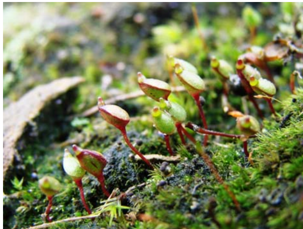
Abb. 2: Gruppe von Buxbaumia aphylla Sporophyten z.T. von Schnecken abgeweidet

Sporophyten waren von Schnecken abgeweidet (Abb. 2). Zum Teil waren die Seten kurz über dem Boden abgefressen oder Kapseln wiesen Beschädigungen auf. Einige leere Kapselhüllen lagen am Boden. Schleimspuren zwischen den Sporophyten deuteten unmissverständlich auf die Tätergruppe hin, die im Bereich der Nacktschnecken zu suchen ist, wobei aber keine gesehen wurde.