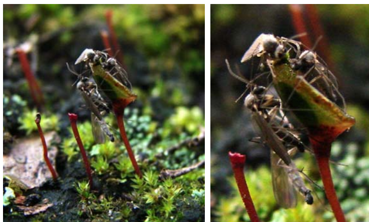
Abb. 3: Pilzmücken an angefressener Kapsel von Buxbaumia aphylla . Spitze der Kapsel ist offen und grünes Sporenpulver wird von Pilzmücken aufgenommen.

An beschädigten Kapseln (durch Schneckenfraß) konnten mehrere adulte Individuen von Pilzmücken ( Mycetophilidae ) gleichzeitig beobachtet werden. Diese saßen auf der Kapsel nahmen das freiliegende grüne Sporenpulver aus den Kapseln auf (Abb. 3).