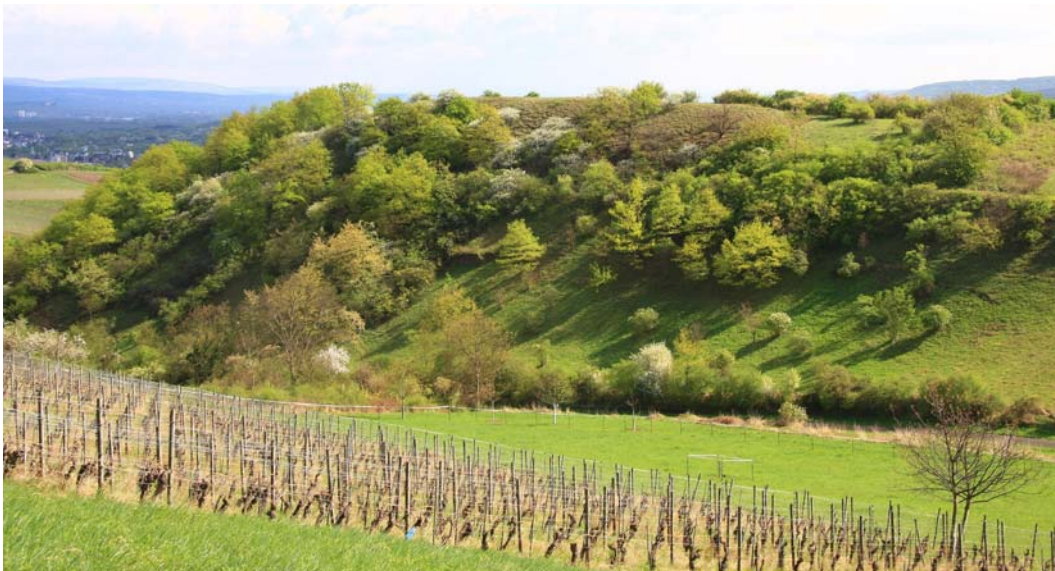
Abb. 2: Blick auf den Westhang des Geschützten Landschaftsbestandteils „Scheerwald“ bei Laubenheim an der Nahe.

Die Böden des Untersuchungsgebietes sind kalkhaltig mit einem pH-Wert im neutralen Bereich. Das Angebot an den wichtigsten pflanzenverfügbaren Nährstoffen ist optimal. Die Weinbergsbrache enthält „Altlasten“ aus ihrer ehemals intensiven Bewirtschaftung (Tab. 1). Die Nährstoffverhältnisse sind mit denen des benachbarten Sponsheimer Berges zu vergleichen (OESAU 2011).